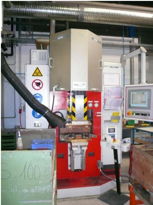
Laserschweissanlage mit Kuka Roboter