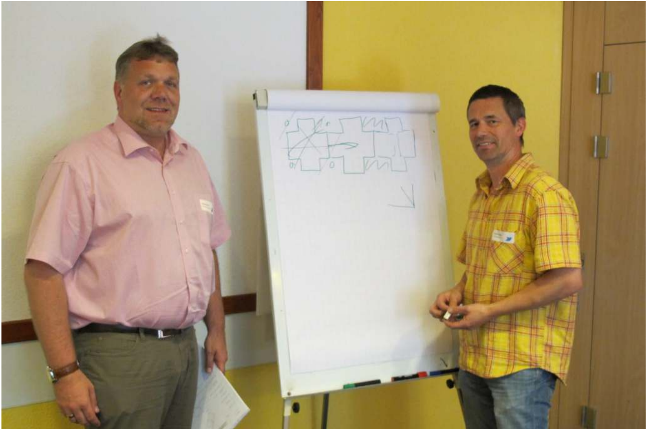
Es machte wirklich Spass .....